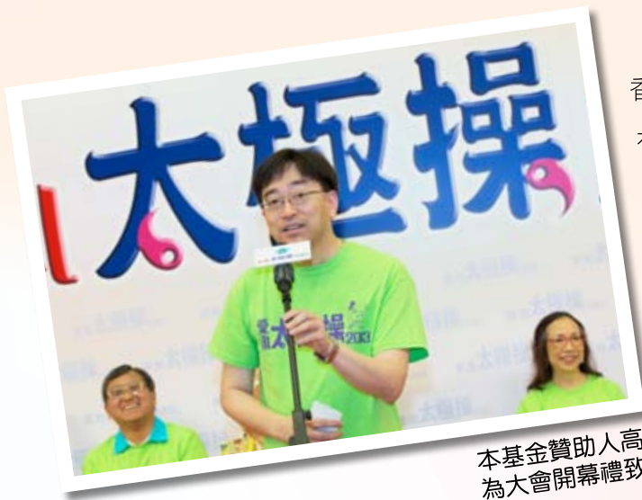
本基金贊助人高永文醫生，BBS，JP 為大會開幕禮致辭

香港帕金森症基金謹此特別鳴謝瑞士諾華製藥(香港)有限公司及博福益普生藥廠等贊助機構、香港太極總會及其他協辦機構、還有眾多捐款善長及參與是次活動人士的鼎力支持，讓是次活動順利進行，請各位讀者欣賞當日盛況。