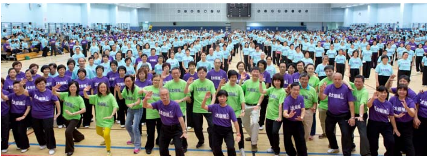
眾嘉賓與參加者大合照

香港帕金森症基金謹此特別鳴謝瑞士諾華製藥(香港)有限公司及博福益普生藥廠等贊助機構、香港太極總會及其他協辦機構、還有眾多捐款善長及參與是次活動人士的鼎力支持，讓是次活動順利進行，請各位讀者欣賞當日盛況。