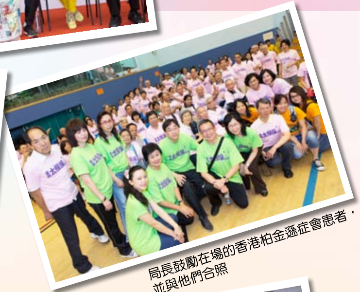
局長鼓勵在場的香港柏金遜症會患者， 並與他們合照