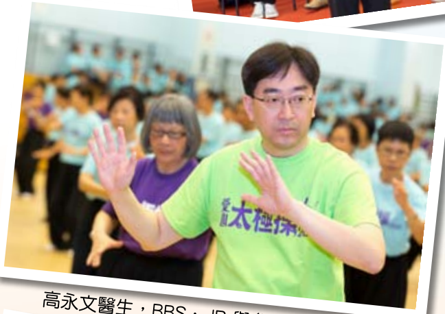
高永文醫生，BBS，JP 與參加者一起耍太極