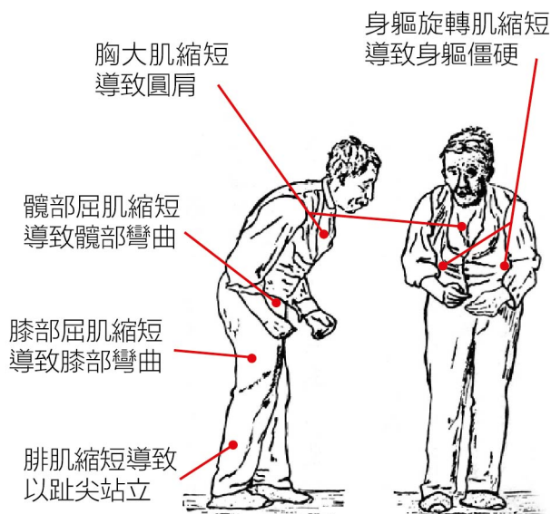
圖1. 帕金森症患者的肌肉縮短問題